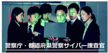
警察庁・都道府県警察サイバー捜査官

全国の約 3,600人 がサイバー空間の脅威への対処に専従 全国で『 サイバー犯罪捜査官 』が活躍中 (※人数は令和7年4月1日現在)