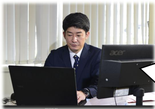
前職は、システムエンジニア

パソコンやスマートフォン等のデジタル機器の分析や解析、現場の捜査員に対する技術的な支援等を行っています。