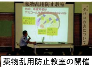
薬物乱用防止教室の開催