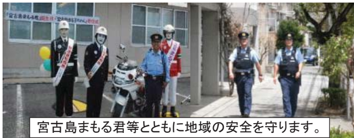
宮古島まもる君等とともに地域の安全を守ります。