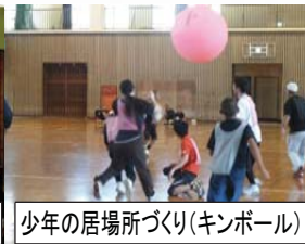
少年の居場所づくり(キンポール)