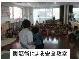
腹話術による安全教室