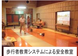
歩行者教育システムによる安全教室