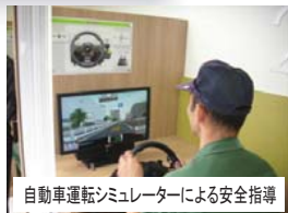
自動車運転シミュレーターによる安全指導