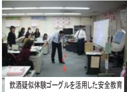
飲酒疑似体験ゴーグルを活用した安全教育