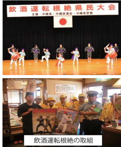
飲酒運転根絶の取組