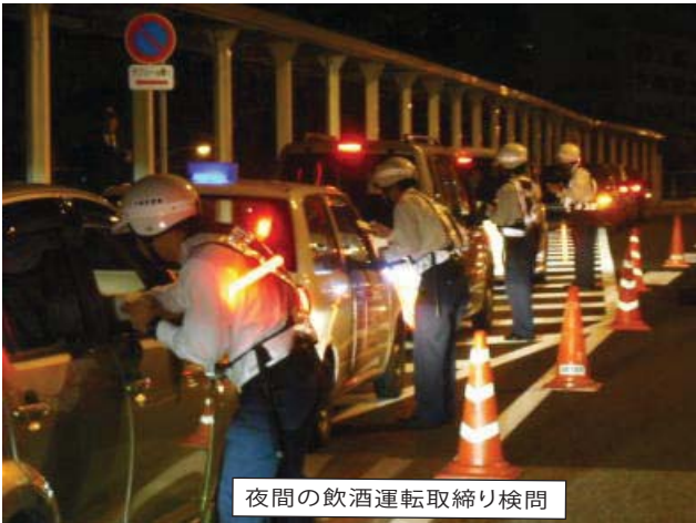
夜間の飲酒運転取締り検問

県内の飲酒絡みの交通人身事故は、構成率で見ると、23年連続全国ワーストワンという厳しい現状にあることから、飲酒運転根絶に向けて県民総ぐるみで取組を推進しています。