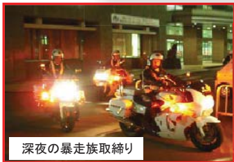
深夜の暴走族取締り