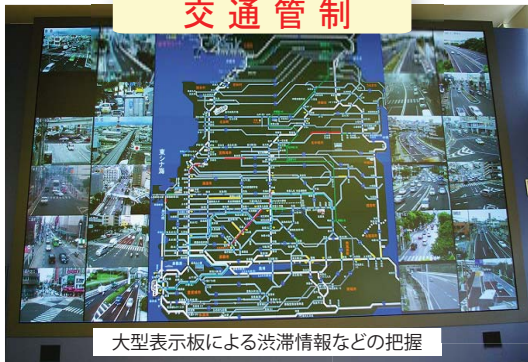
大型表示板による渋滞情報などの把握