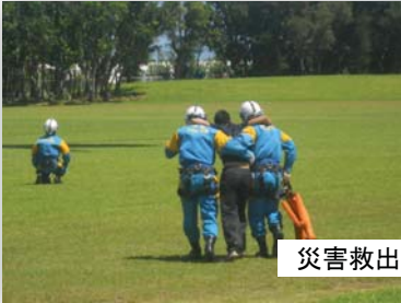
災害救出救助訓練