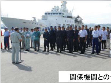
関係機関との合同訓練