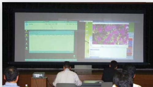
サイバーテロ想定共同訓練の実施

警察では「重要インフラの基幹システムに対する電子的攻撃」又は「重要インフラの基幹システムにおける重大な障害で、電子的攻撃による可能性が高いもの」をサイバーテロと位置づけ、その未然防止と発生した際の被害拡大防止に向け、県内重要インフラ事業者(情報通信・金融・航空・鉄道・電力・ガス・政府行政サービス・医療・水道)と連携した、各種取組を推進しています。