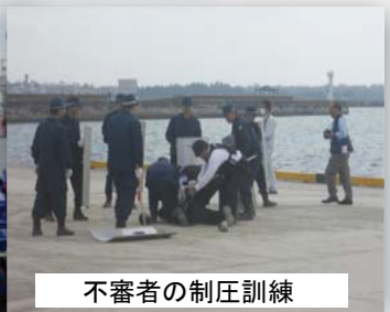
不審者の制圧訓練