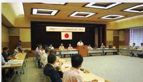
サイバーテロ対策協議会総会の開催